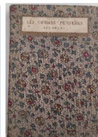
Deux livres de la collection de Léo Gausson.